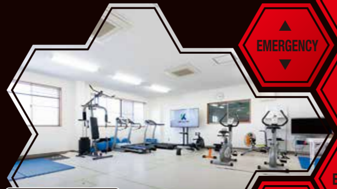
トレーニングジム TRAINING GYM